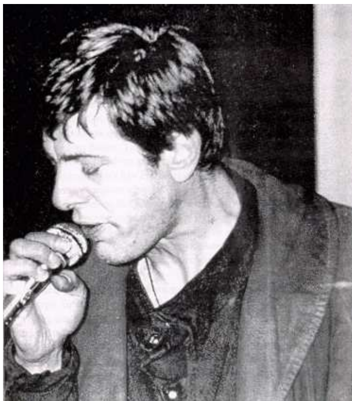
Από το βιβλίο του Ντίνου Δηματάτη "Παύλος Σιδηρόπουλος. Το μοναχικό μπλούζ του Πρίγκηπα